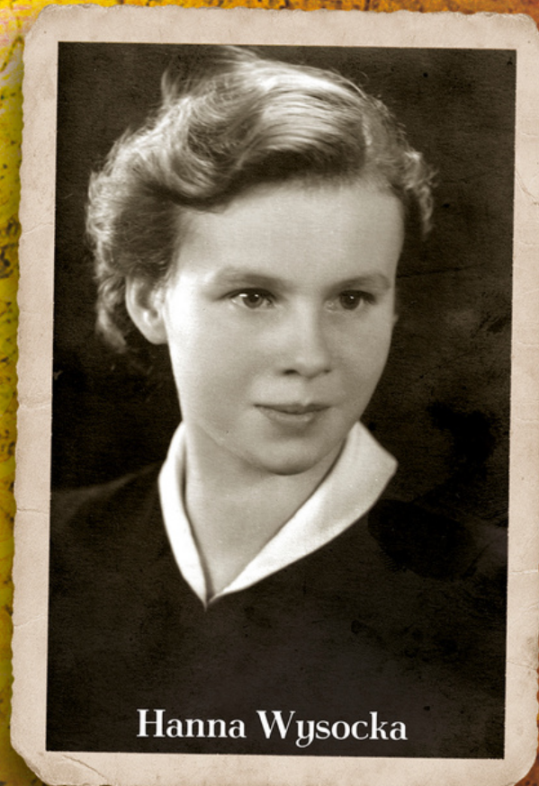
lata 40. XX w.