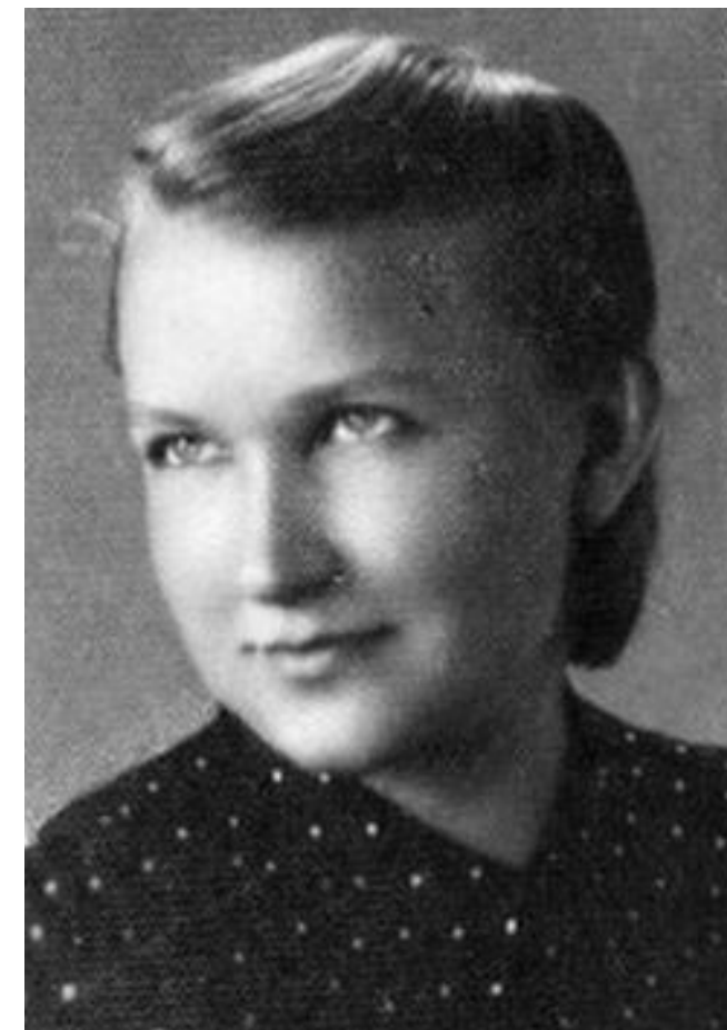
Elżbieta Zawacka - jedyna kobieta wśród cichociemnych