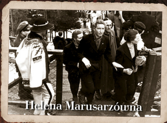
(pośrodku) podczas Mistrzostw Świata w Narciarstwie Klasycznym FIS w Zakopanem, 1939 r.