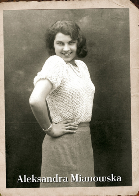
Autor nieznany, ze zbiorów PAU, BZS.RKPS. 12327 k.11, digitalizacja: PAU, projekt PAUart, pauart.pl domena publiczna.