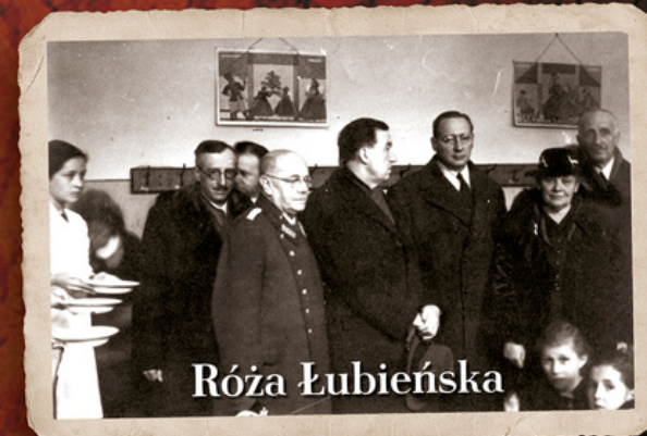
(druga z prawej), 1941 r.