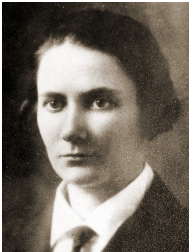
Maria Wittek - pierwsza kobieta ze stopniem generała WP