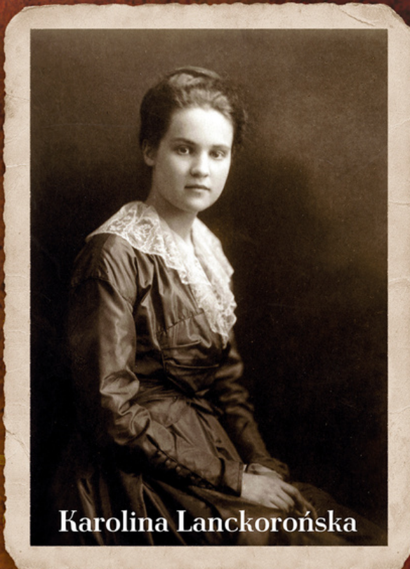
Austria, ok. 1920 r., autor nieznany, ze zbiorów PAU, AN_KIII_150_287, digitalizacja: PAU, projekt PAUart, pauart.pl domena publiczna.