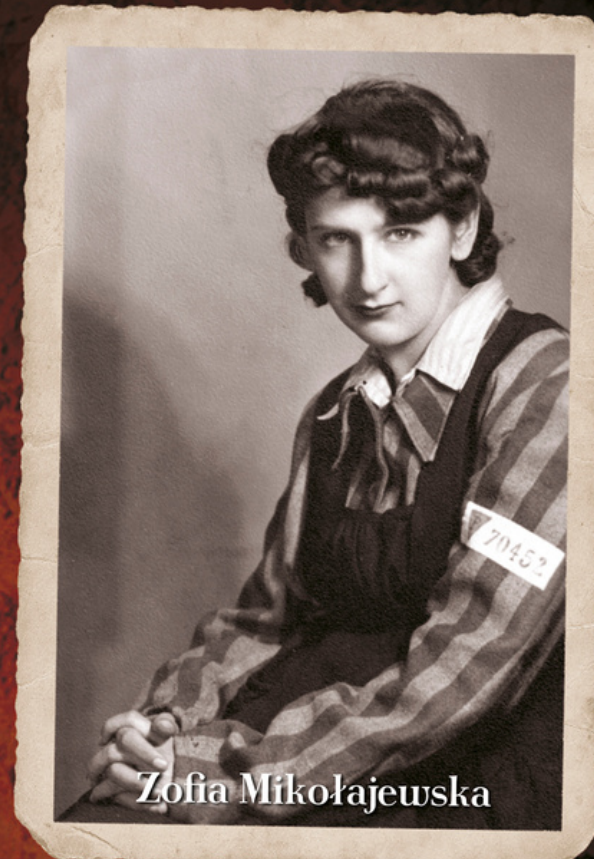
w pasiaku obozowym, lata 40. XX w.