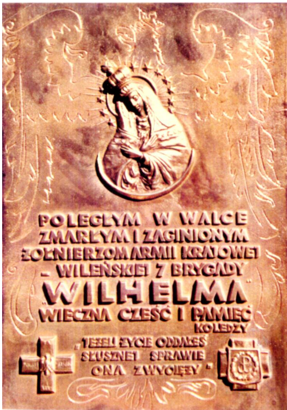
Tablica epitafijna obecnie znajdująca się w Bazylice Mariackiej w kaplicy Św. Barbary w Gdańsku. Odsłonięta i poświęcona dnia 9 maja 1987 roku.