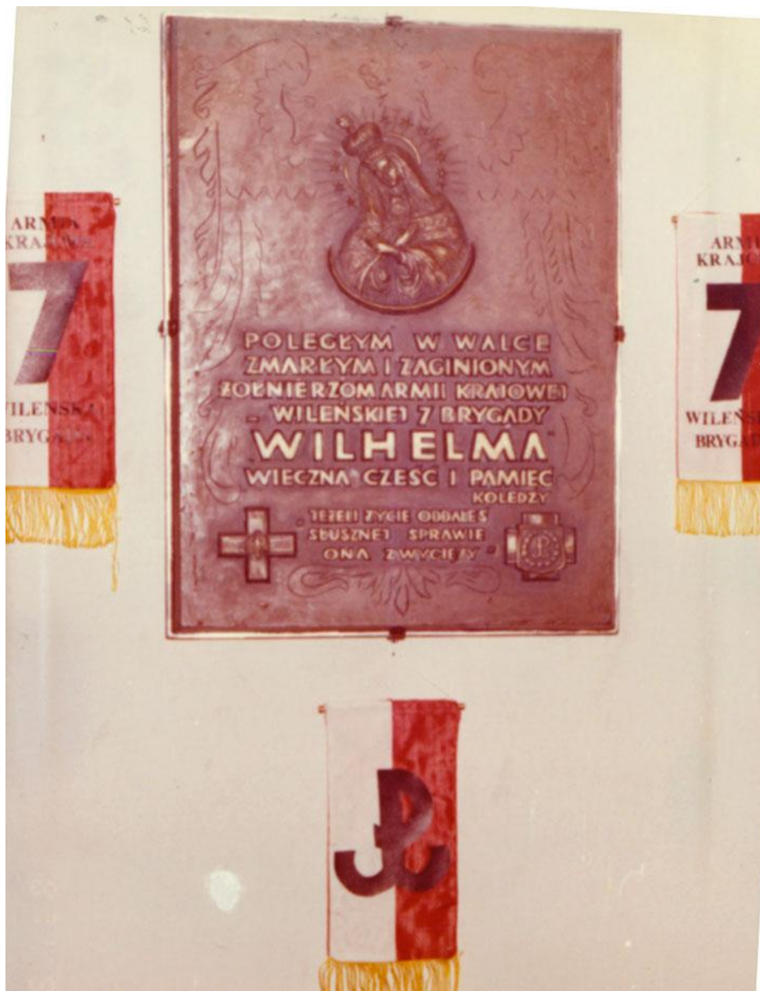
Replika tablicy epitafijnej Brygady odsłonięta i poświęcona w kościele pod wezwaniem Matki Boskiej Ostrobramskiej w Szczecinie – Żelechowo w dniu 03.09.1997 r.