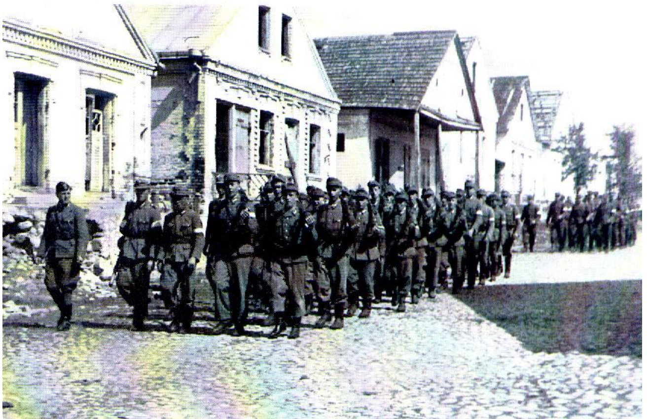
Dziewieniszki. Czerwiec 1944 r. Przemarsz 1 i 2 plutonu przez wieś.