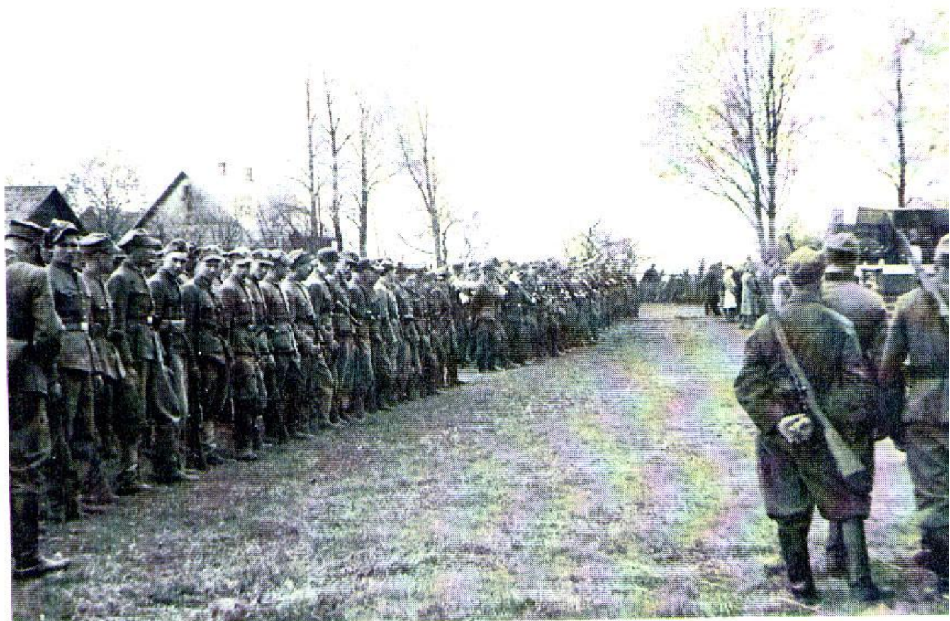
Dorże. Początek maja 1944 r. 1 i 2 plutonu na koncentracji III Zgrupowania.