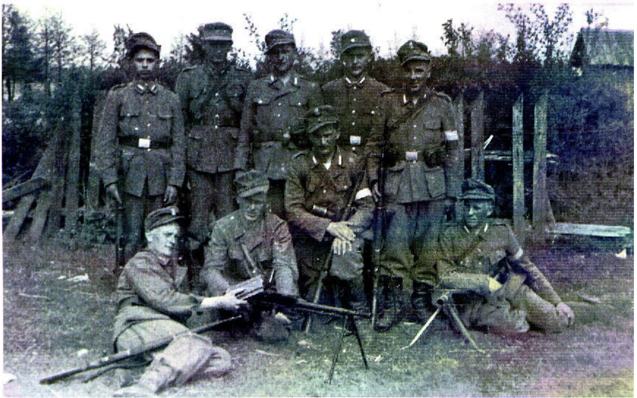
Grupa żołnierzy 3 plutonu na miejscu postoju. Początek czerwca 1944 r.