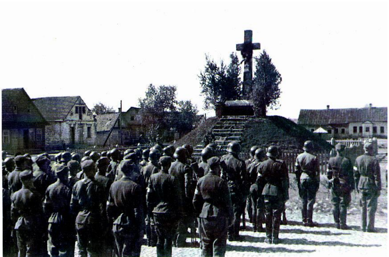
Dziewieniszki. Czerwiec 1944 Żołnierze 1 i 2 plutonu przed pomnikiem upamiętniającym połączenie Ziemi Wileńskiej z Macierzą.