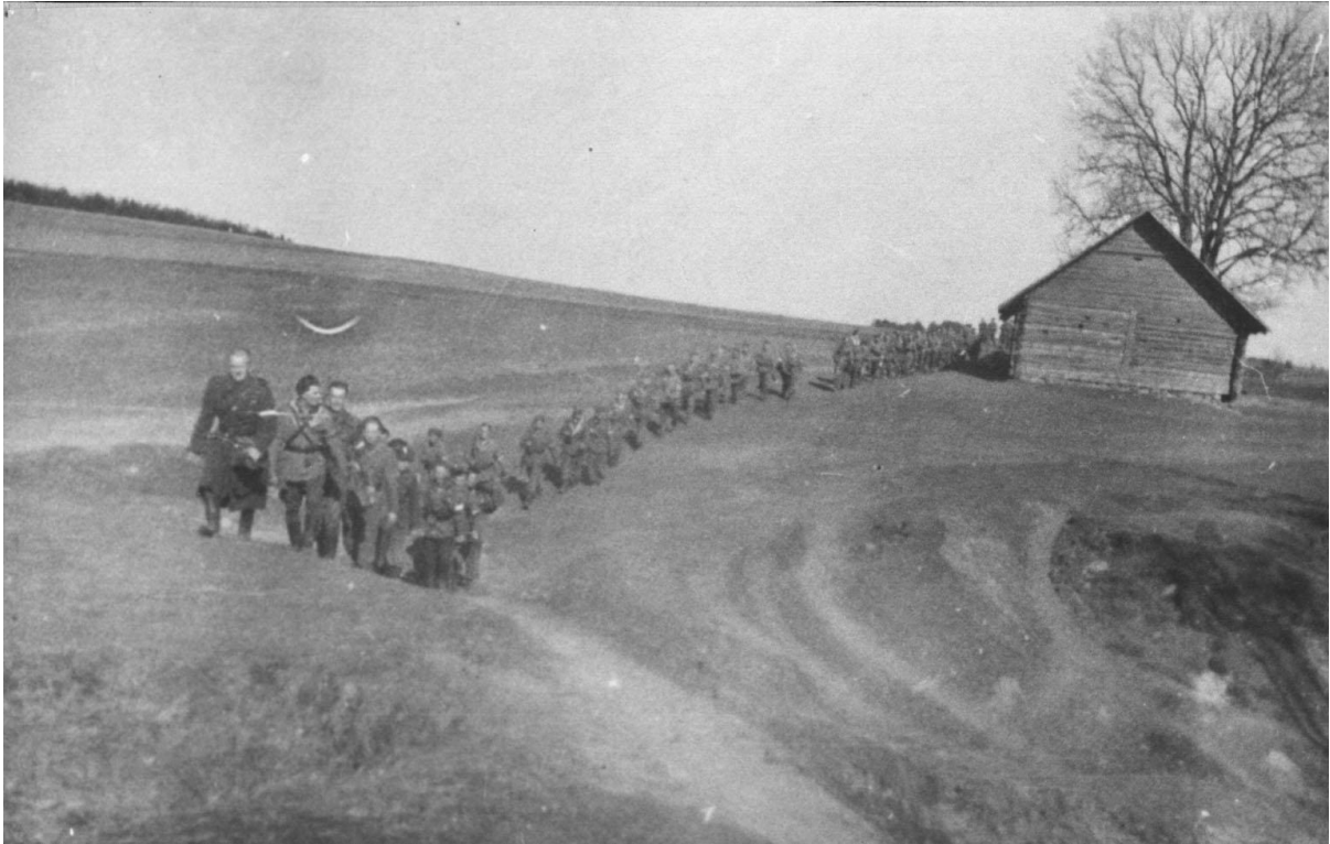
Przemarsz Brygady, zmiana miejsca postoju. Wiosna 1944 r. Okolice Sorok Tatarów.