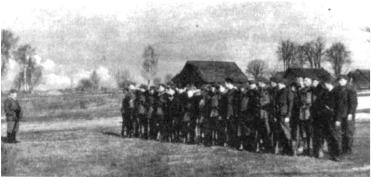
1 Pluton 1 Kompanii we wsi Wasiołce. Przed atakiem na Murowaną Oszmiankę.