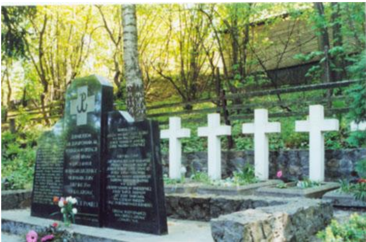
Cmentarz żołnierzy 3. Brygady por. „Szczerbca” w Kolonii Wileńskiej koło Wilna. Republika Litewska.