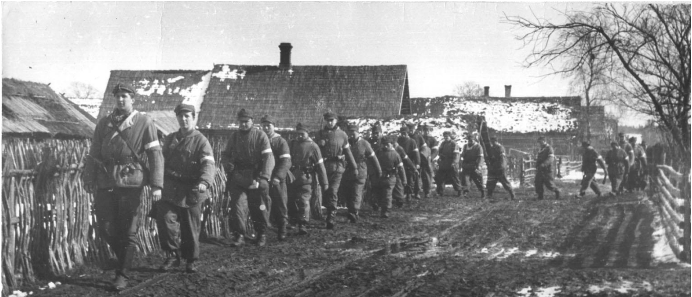
2 pluton 2 kompanii Henryka Siemaszki "Dłuższy" w przemarszu przez wieś. Turgiele. Kwiecień 1944 r.