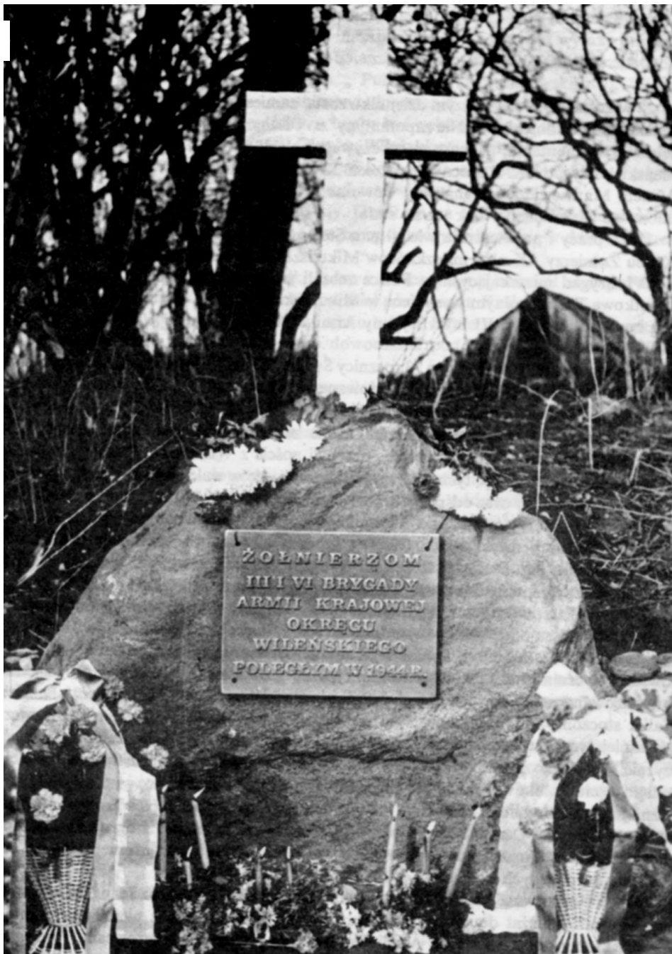
Krzyż centralny i tablica epitafijna na cmentarzu brygadowym w Mikuliskach Republika Białoruska.