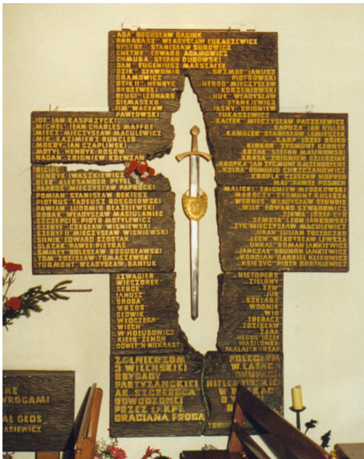
Epitafium poległych, zamordowanych i zaginionych żołnierzy 3. Brygady por. „Szczerbca” w kościele pod wezwaniem Matki Boskiej Ostrobramskiej w Szczecinie – Żelechowo.