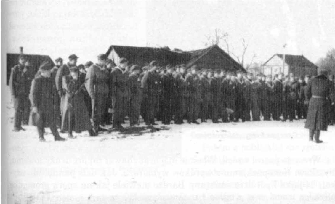
1 kompania przed wymarszem na akcję Nowe Troki. Koniec marca 1944 r.