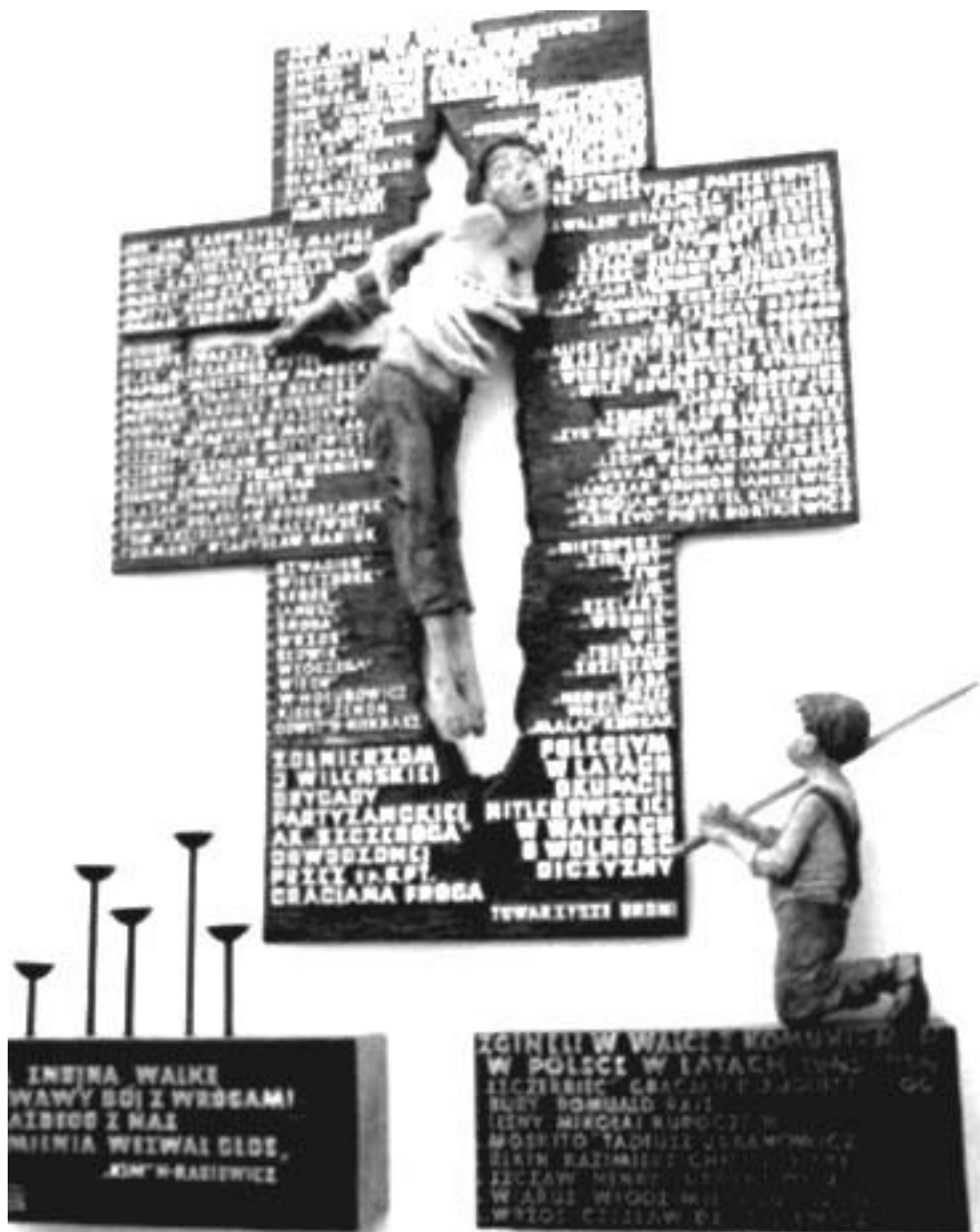
Epitafium poległych, zamordowanych i zaginionych żołnierzy 3. Brygady por. „Szczerbca” w Bazylice Mariackiej w kaplicy Św. Barbary w Gdańsku.