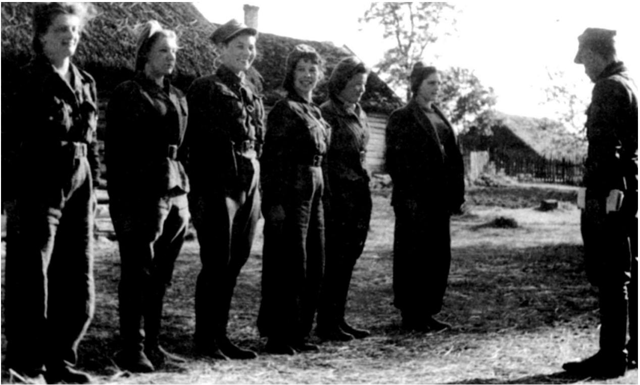
Odprawa sanitariuszek 4. i 5. Brygady przed wspólną akcją .