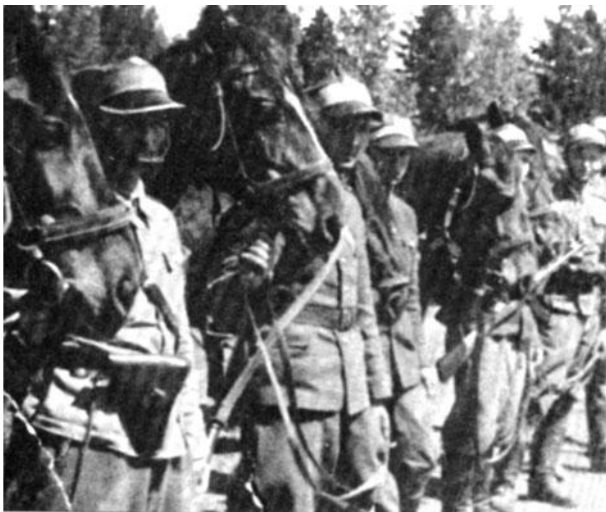
Odprawa zwiadu konnego. Lato 1944 r.