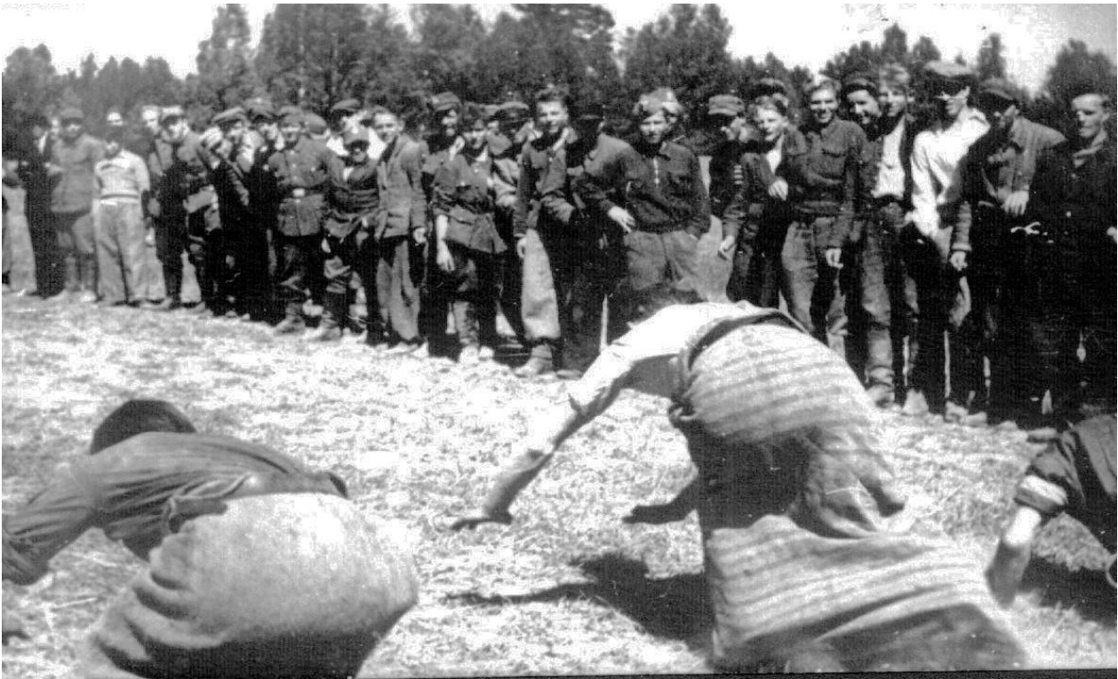
Ćwiczenia połączone z zabawą sanitariuszek. Podchodzenie do rannego na polu walki. Maj 1944 r.