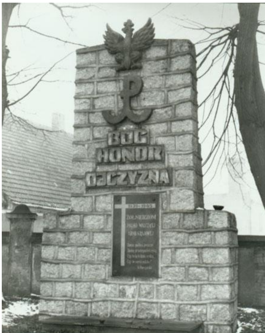
Tablica epitafijna i pomnik ufundowany przez żołnierzy Brygady w Rucianem – Nidzie.