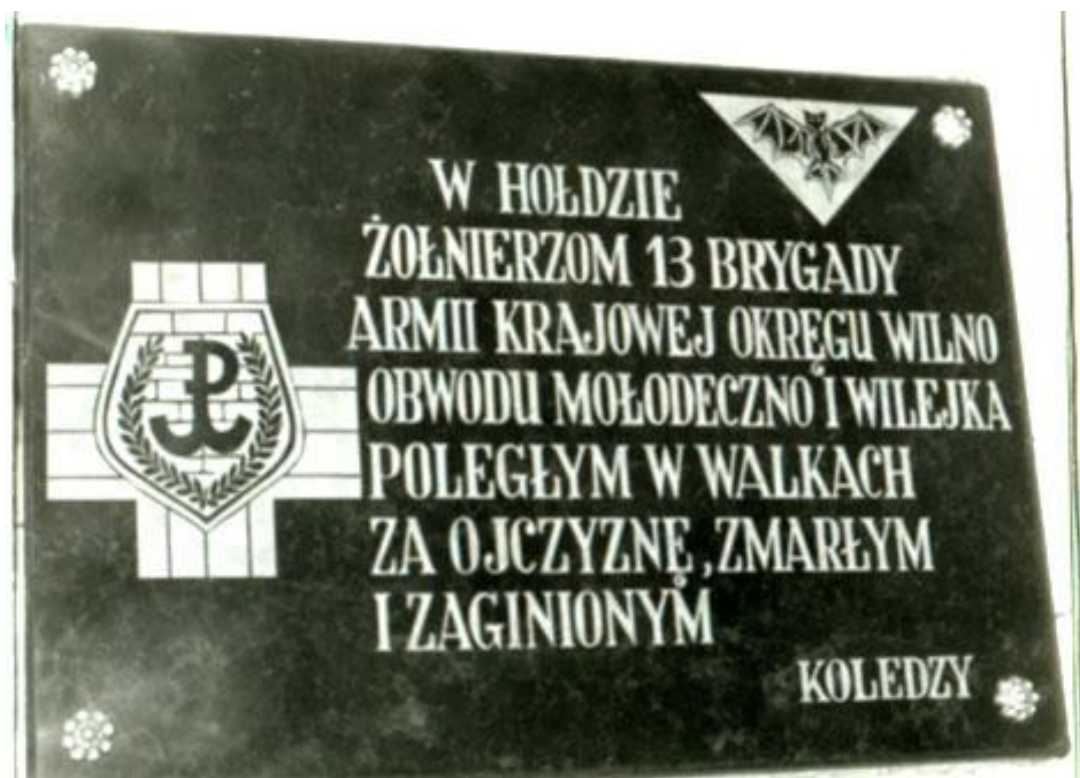
Tablica epitafijna Brygady w kościele w Warszawie.