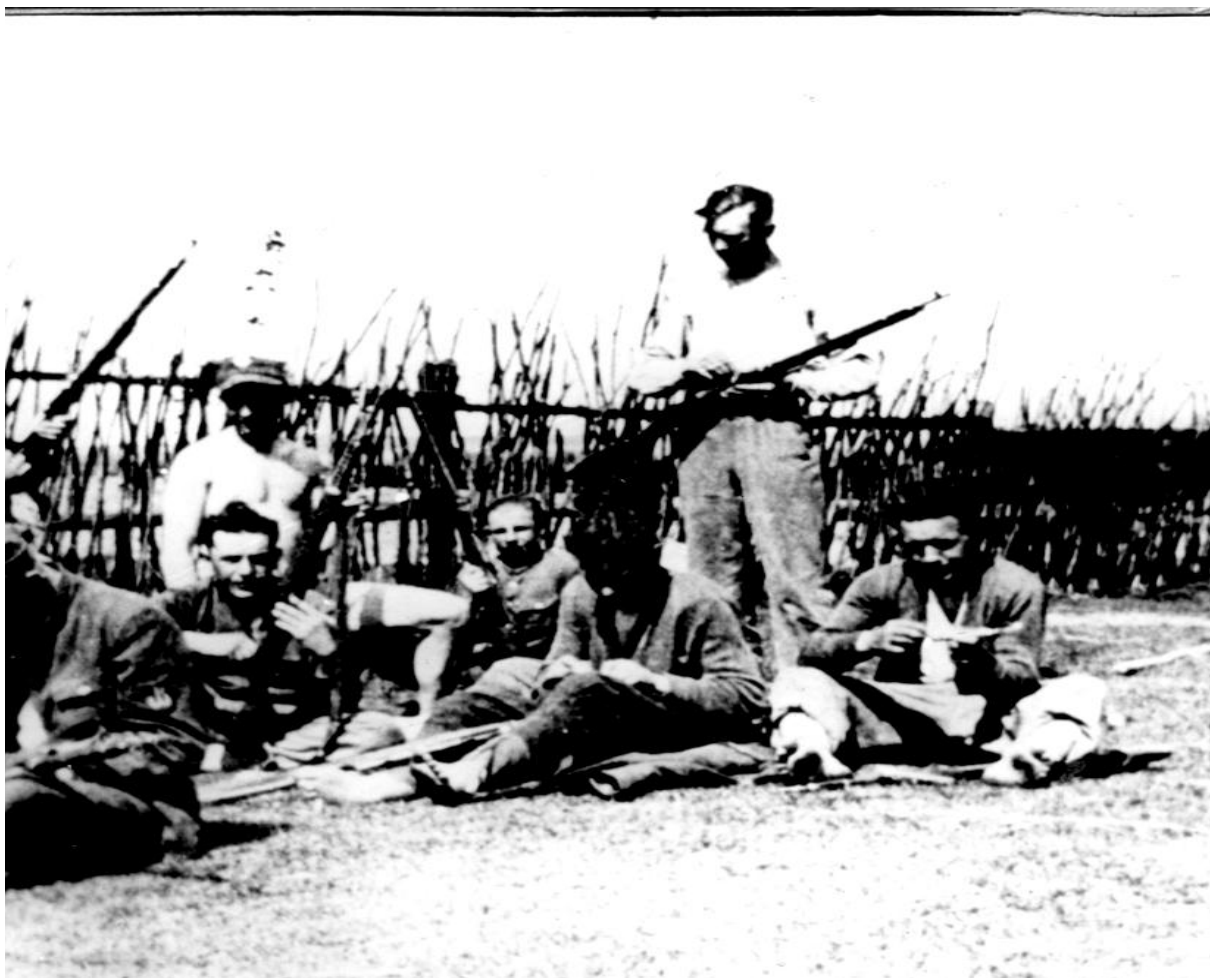
Maj 1944 Nowa Wieś k/Oszmiany. Czyszczenie broni.