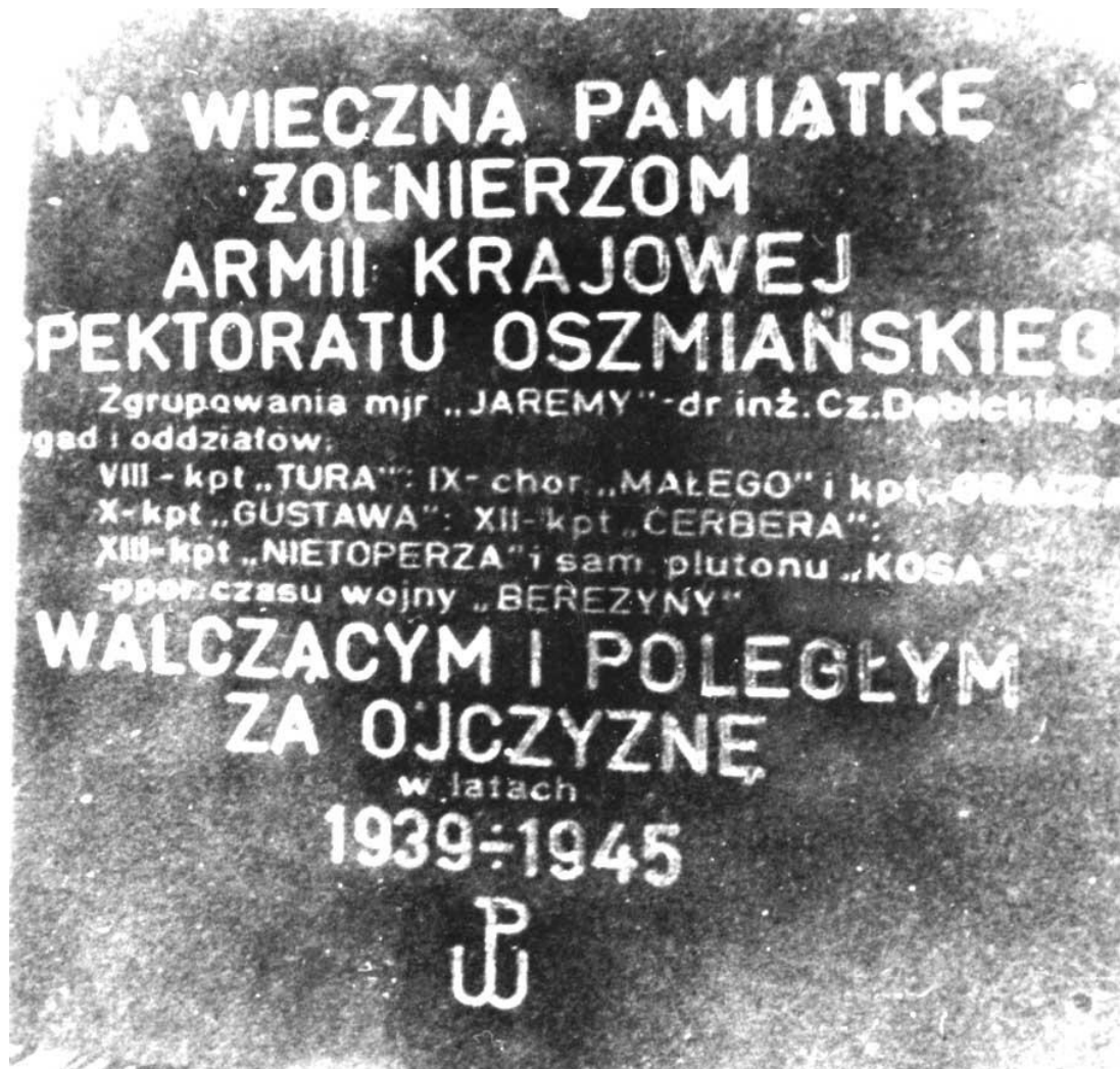
Brygadowa tablica epitafijna w kościele p. w. Matki Boskiej Zwycięskiej w Toruniu. Odślonięta i poświęcona 12.05.1984 r.