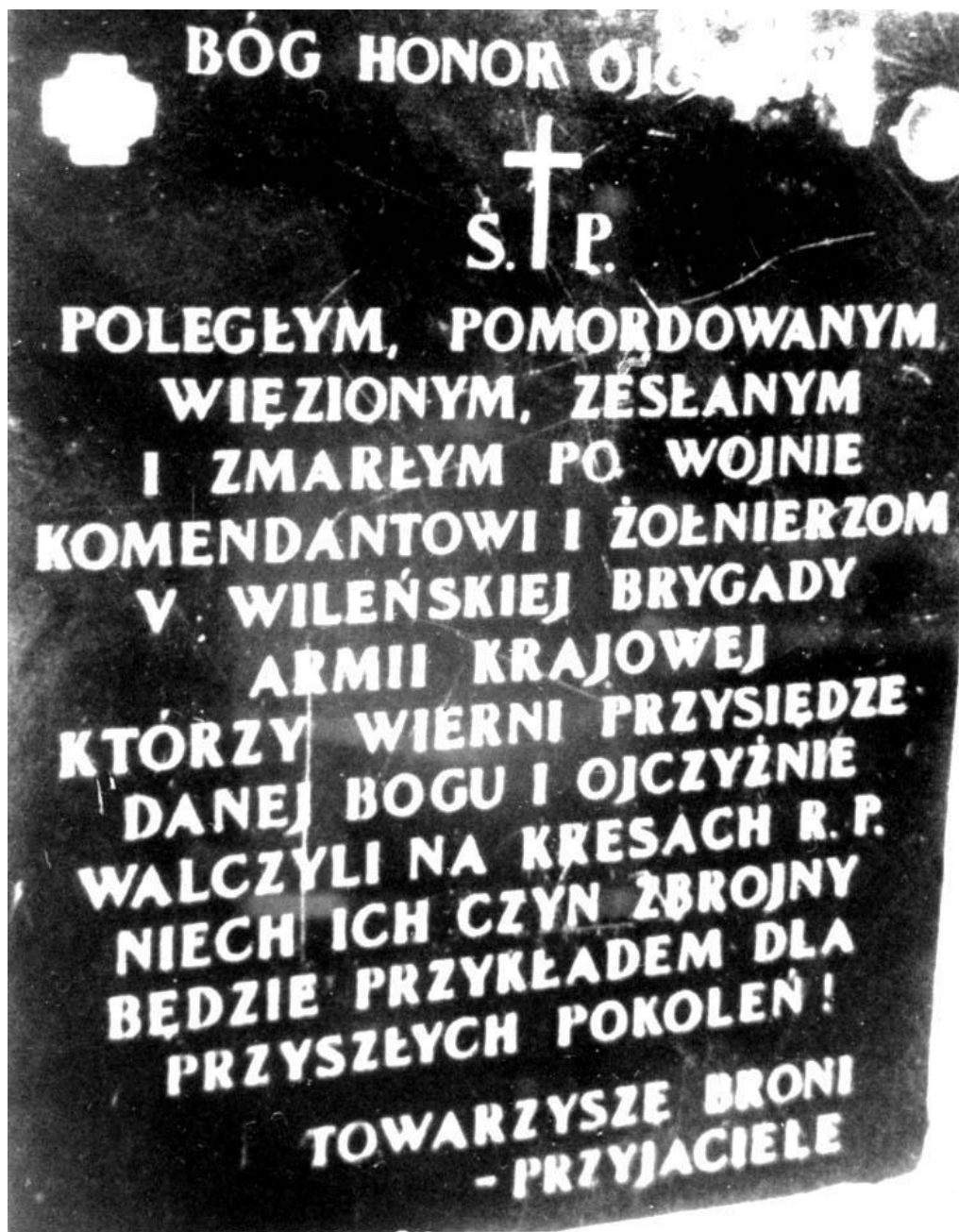
Tablica epitafijna 5. Brygady, poświęcona i odsłonięta 6.10.1985 r. w kościele pod wezwaniem Św. Antoniego w Warszawie.