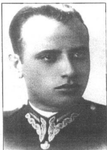
Komendant Brygady Por. Zygmunt Szendzielarz „Łupaszko”