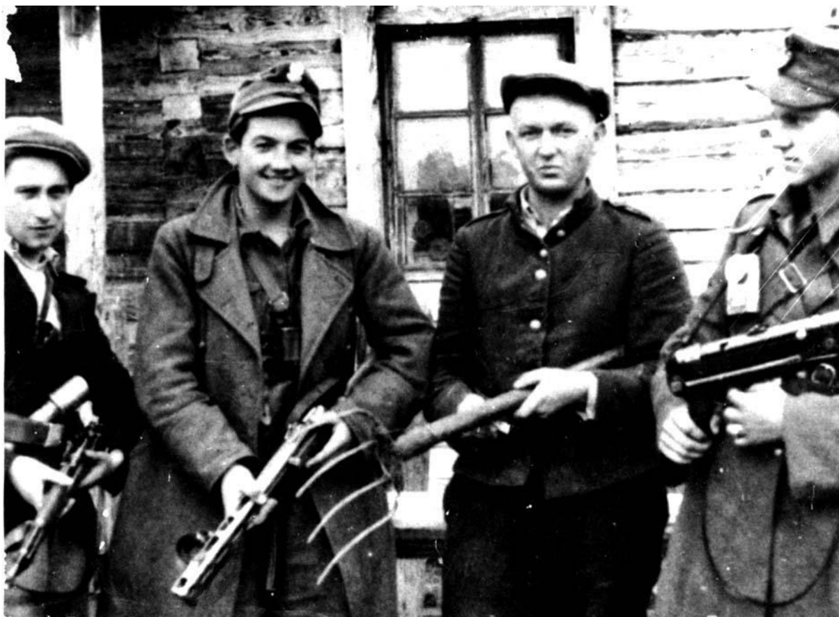
Patrol „Chińczyka” Wiosna 1944