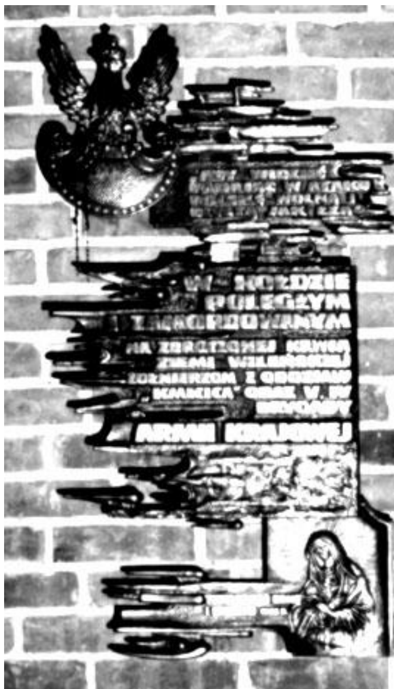
Tablica epitafijna w kościele pod wezwaniem Św. Barbary w Gdańsku.