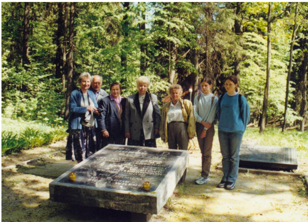
Kalwaria Wileńska. Zbiorowa mogiła żołnierzy poległych w walce z Niemcami pod Krawczunami i Nowosiólkami.