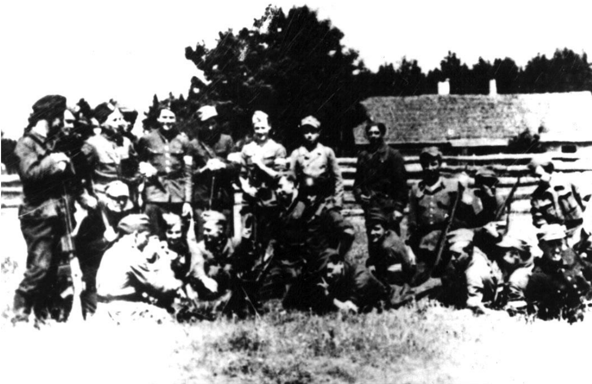
4 i 2 drużyna z 1 plutonu po przybyciu na miejsce postoju. Okolice Bujwidz. Maj 1944 r.