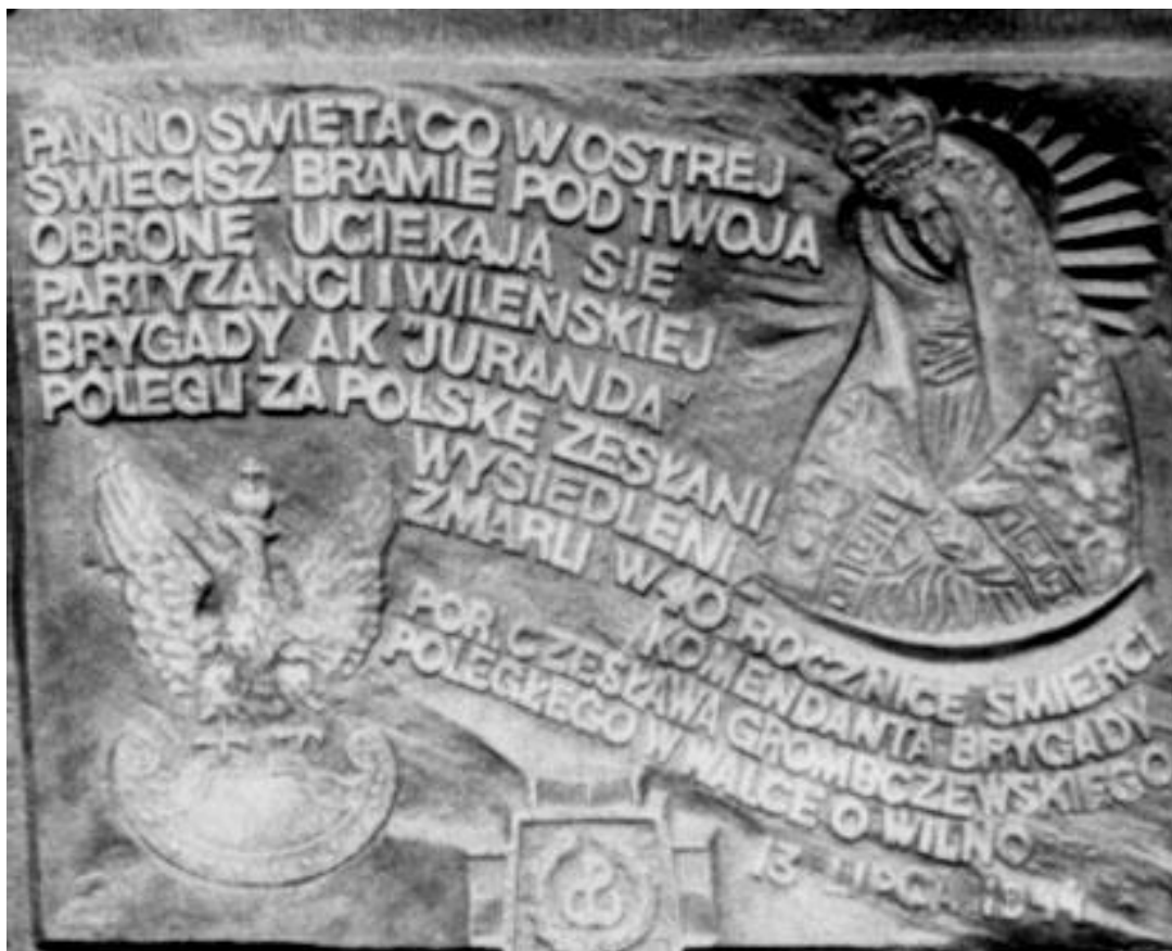
Tablica epitafijna poświęcona poległym, zaginionym i zamordowanym żołnierzom Brygady, odsłonięta i poświęcona w kościele OO jezuitów w Warszawie ul. Narbutta.