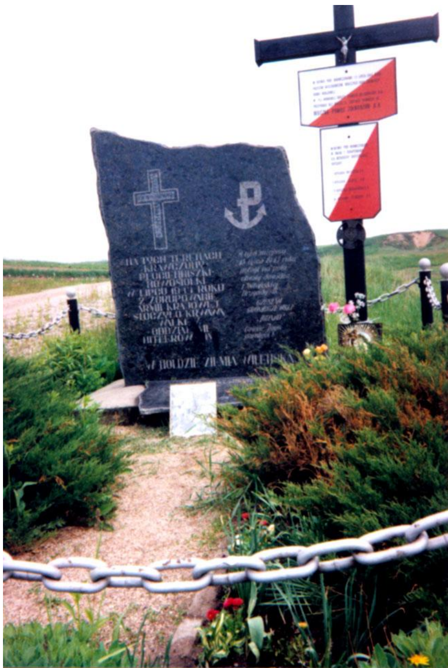
Miejsce walk Oddziałów Armii Krajowej z doborowymi oddziałami wojska niemieckiego wycofującego się z Wilna w dniu 13 lipca 1944 r.