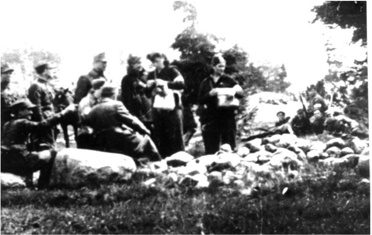
Lipiec 1944 r. Brygadowy punkt opatrunkowy.