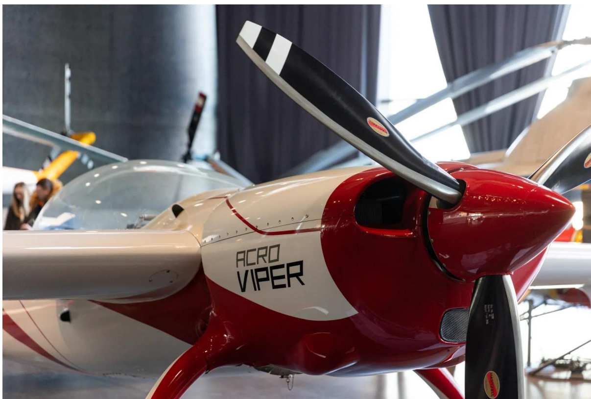
Samolot akrobatyczny AcroViper

W 2025 roku kultura w Krakowie przyciągnęła więcej widzów niż w 2024. Zainteresowanie ofertą muzeów rosło, a spadki w przypadku innych instytucji kultury miały konkretne przyczyny.