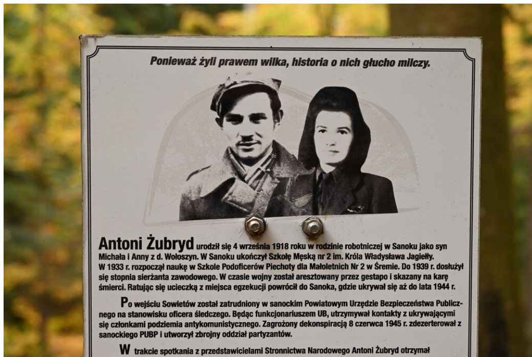
fol. Starostwo Powiatowe w Brzozowie