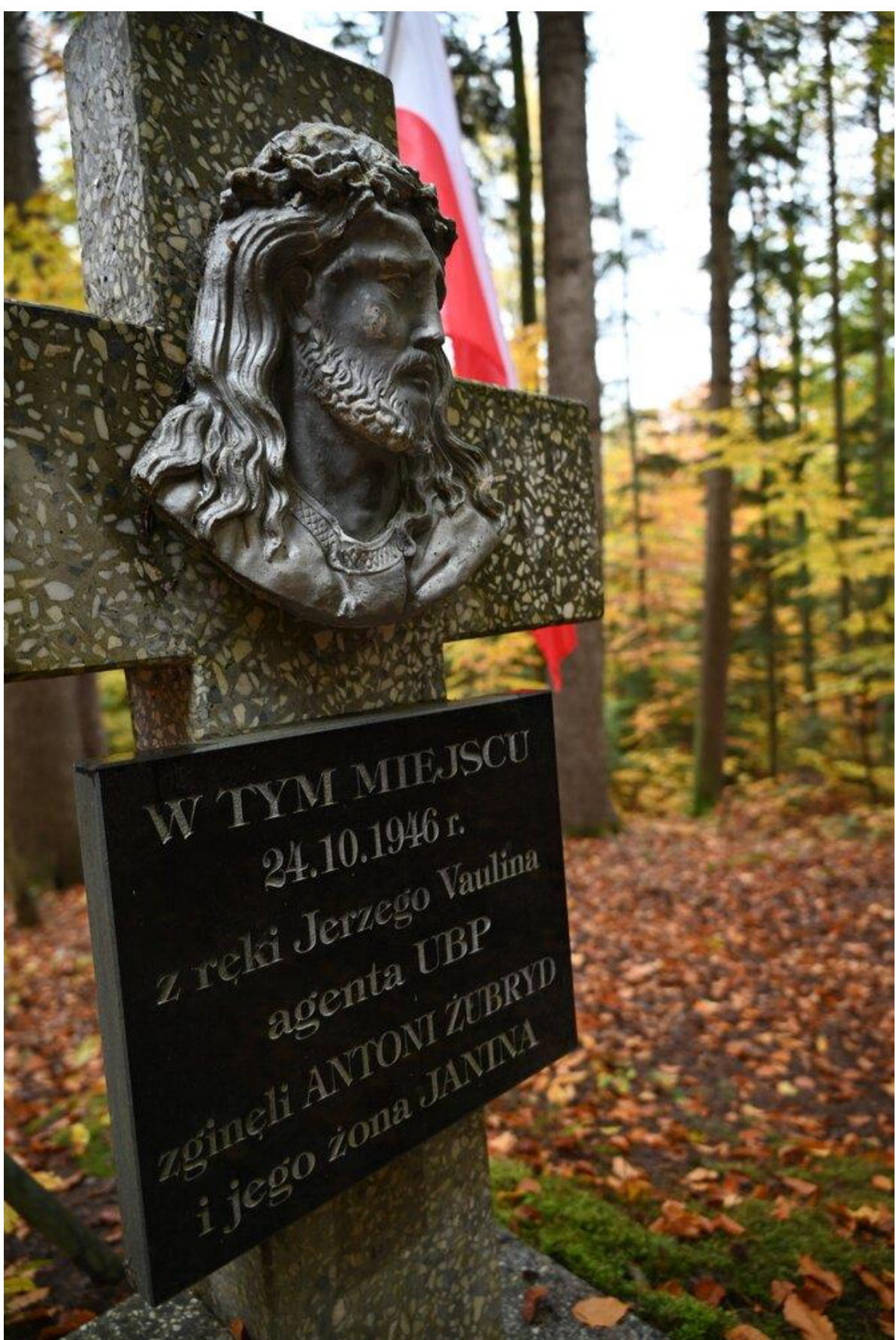
fol. Starostwo Powiatowe w Brzozowie

Wkrótce stworzył Samodzielny Batalion Operacyjny Narodowych Sił Zbrojnych „Zuch”, który działał na terenie powiatów Sanok, Brzozów i Krosno. Oddział, liczący nawet 300 żołnierzy, przeprowadził ponad 200 akcji zbrojnych przeciwko UB, MO i KBW.